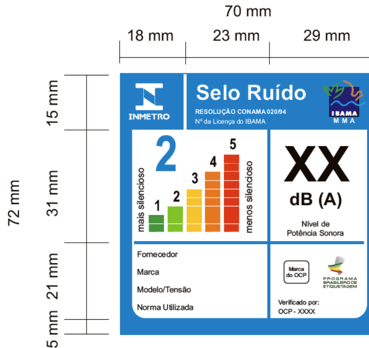
Figura A.1 – Formato e dimensões mínimas do Selo Ruído.